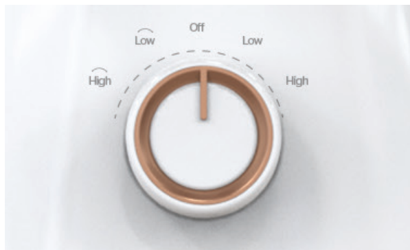
(Hình ảnh mặt điều khiển)